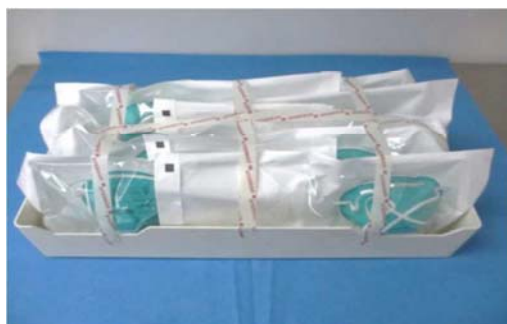
図 1：ロード用の N95 マスクの包装とトレイへの積載例