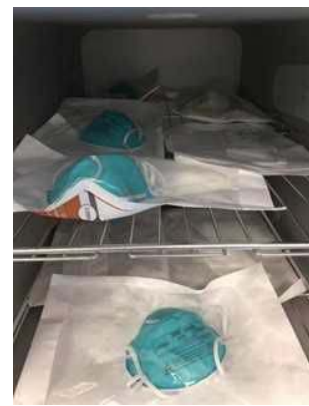
図 2：ロード用の N95 マスクの包装と棚への積載例