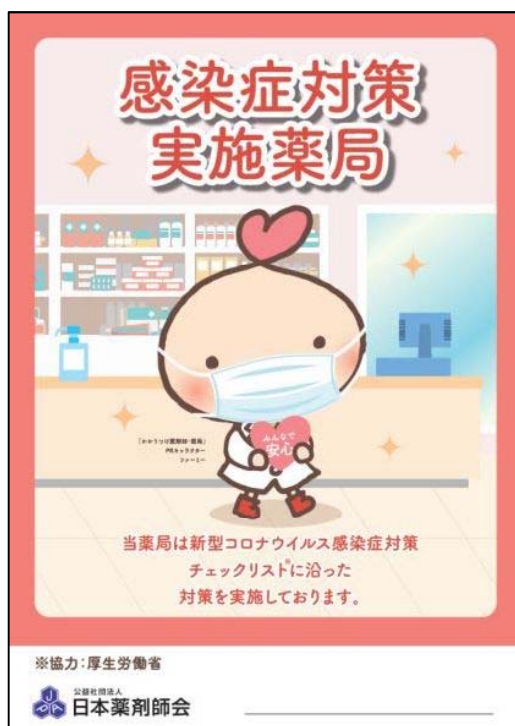
みんなが安心マーク

本会が作成する同マークについては、「薬局内における新型コロナウイルス感染症対策チェックシート【第二版】」及び「薬局内における新型コロナウイルス感染症対策チェックリスト」(項目は別紙3を参照)の全ての項目を実践していることを自己確認の上、同マークとともに「薬局内における新型コロナウイルス感染症対策チェックリスト」を掲出することで使用が可能となっている。